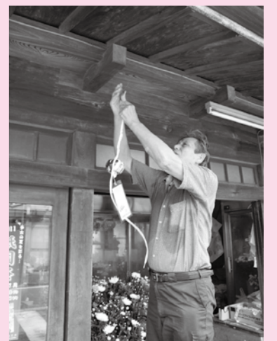
風鈴を軒先にかける店主