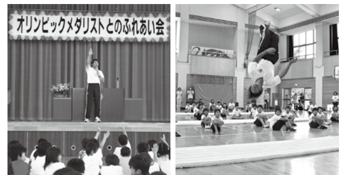
児童たちに将来の夢を聞く 宙返りを披露