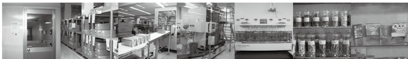
取材協力：多古工業団地連絡協議会 (株)龍角散千葉工場

これからも皆様に健康と安心を提供し続けるため、今まで築き上げてきたことを基軸に、より新しいものを求め、信頼されるよう努力していきます。また、従業員が楽しく働ける場所でありたいと思います。