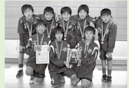
■「高学年の部 優勝」タコFCマドリッド