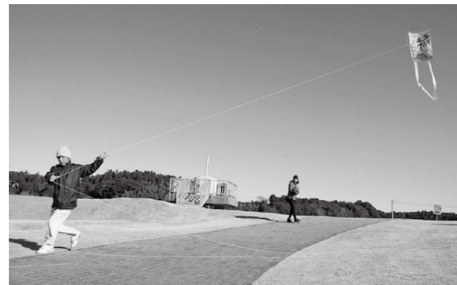
■勢いよく揚がる色鮮やかな大凧