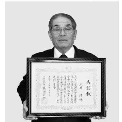
■千葉県知事表彰 『交通安全功労』

「一緒に頑張ってくれたスタッフに感謝します。食品を扱っているので一日も気を抜くことはできませんが、これからも安心・安全を第一に頑張ります」