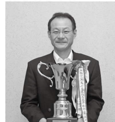
■名誉賞(農林水産大臣賞) 『千葉県豚共進会 肉豚の部』

「先輩方や家族の心強い支えが励みとなり、保護司を続けることができました。これからも明るい社会づくりに貢献していきたいと思っております」