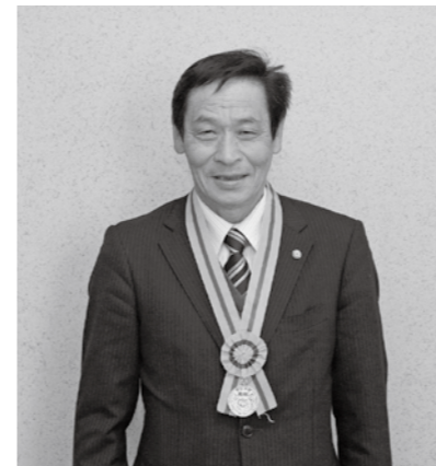
■法務大臣表彰 『更正保護功労』