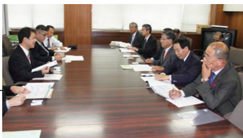
圏央道の早期着工に向けて意見交換する越川会長ら

意見交換では、早期着工要請と併せて、開発に伴い両町の基幹産業である農地の確保や農業への影響等が危惧されるため周辺への配慮などを地域の意見として提示しました。