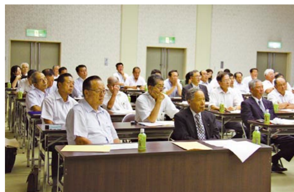
講演に聞き入る各町議員の皆さん