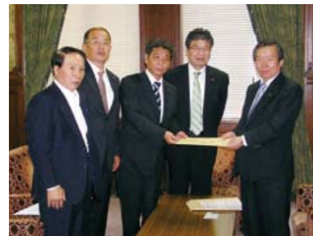
国会で決議書を提出