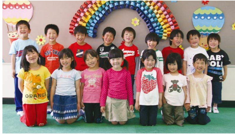
多古幼稚園 そらぐみ (5歳児) 『森の時計屋さん』 「そらぐみのみんなで楽しい時間を過ごそうね!!」