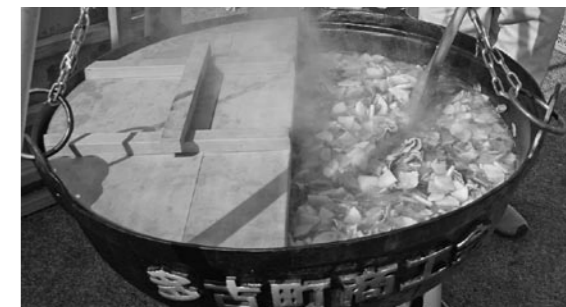
■無料配布された多古のブランド豚「元気豚」を使った豚汁。おいしそうに出来上がりました!