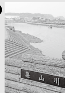
千葉県山武農林振興センター (独)水資源機構千葉用水総合事業所

わたしたちの町を流れる栗山川は、九十九里・南房総地域の飲料水や九十九里地域の農業用水、千葉臨海工業地帯およびその周辺の工業用水として利用されています。また栗山川は、サケが卵を産むために海から上ってくる川でもあり、その環境保全は地域にとって重要な課題です。栗山川にごみを捨てたり、油類や有害物質が流出したりすることのないよう一人ひとりが注意を払い、川をきれいにするよう心掛けましょう。