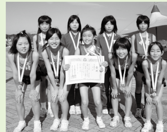
3位に入賞した中村小女子チームの皆さん