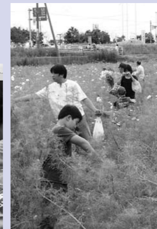
コスモス畑では、花を摘み取り記念撮影をする人も

栗山川を彩る可憐なコスモスの花に包まれて、さわやかな季節の訪れを感じてもらおう『コスモスマつり』。今年は9月27日から10月13日までを、コスモス無料摘み取り期間として開催されました。