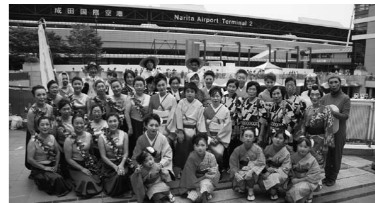
歌と踊りのパフォーマンスを披露した「ナンシー会」の皆さん