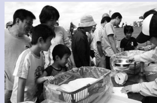
『新米500gお持ち帰り』は長蛇の列。さあ、何グラムかな?