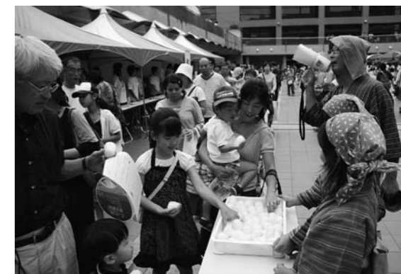
長蛇の列をなした「火曜会」による多古米おにぎりの無料配布