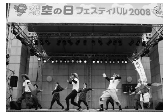
ステージを盛り上げた銭形ダンサーズによる“多古マイマイ音頭”

さらに会場内では、多古町異業種交流青年会「火曜会」が多古米おにぎりの無料配布を実施。「おかずのいらぬ多古米」を味わおうと、県内外から訪れた多くの皆さんが長蛇の列をなし、用意された800個の新米おにぎりが、あっという間になくなるほどの大盛況となりました。ふるさと“多古”の魅力を大いにPRしてくれた皆さん、ありがとうございました。