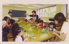
第4研修室 美術・工芸等の学習活動に利用できます。