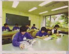
第1研修室 研修等で使用しない時には、学習室として開放しています。