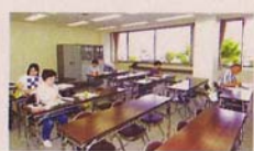
第2研修室 各種の学級、講座に、また会議室としても利用できます。