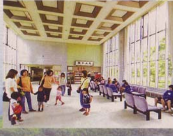
ホール 町民のみなさんの日ごろの芸術文化・創作活動の成果を発表・展示する場として利用できます。