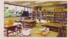
第5研修室 陶芸の窯や、ろくろ等をそろえてあります。