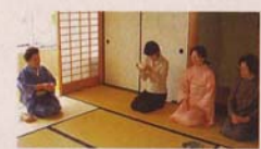
茶室 茶道の研修のために活用して下さい。