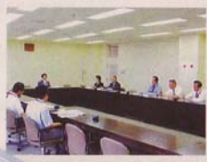
会議室 各種会議、研修に利用できます。