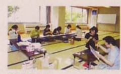
第3研修室 和室での華道、舞踏・レクリエーションに、また各種の研修等に広く利用できます。