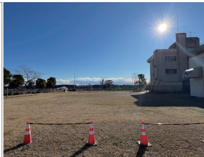
増築が予定される第二グラウンド