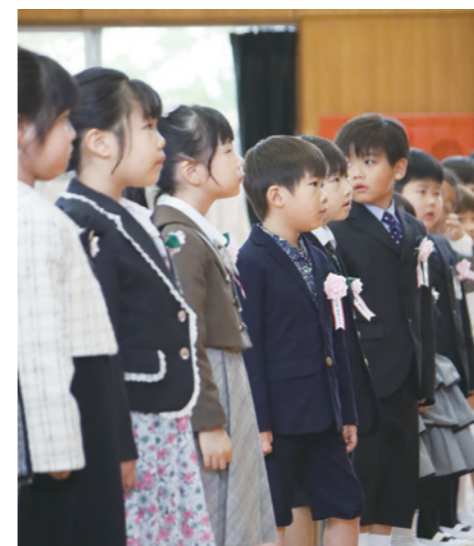
多古第一小学校入学式

このほかの、国民健康保険事業や介護保険事業などの4特別会計予算と病院事業、水道事業、農業集落排水事業の3公営企業会計予算を合わせた全会計の予算総額は151億7199万2千円となりました。