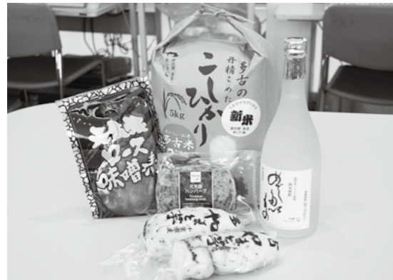
食から町の活性化を

町長 道の駅多古では、経営者側の各部会長が定期的に話し合いの場を設けることとし、そこに町の担当課も参加しています。その中で、道の駅のリニューアルや増改築に向けた具体的な検討も行う予定です。このことにより、新拠点の整備と方向性をすり合わせながら、双方の機能や役割を十分に発揮できる施設検討を行い、そしてエリアとしての集客力を高めることによって、道の駅多古の売上回復と経営改善、出品者の収入増加を目指したいと考えております。今後とも両施設の整備実現に向けて注力してまいります。